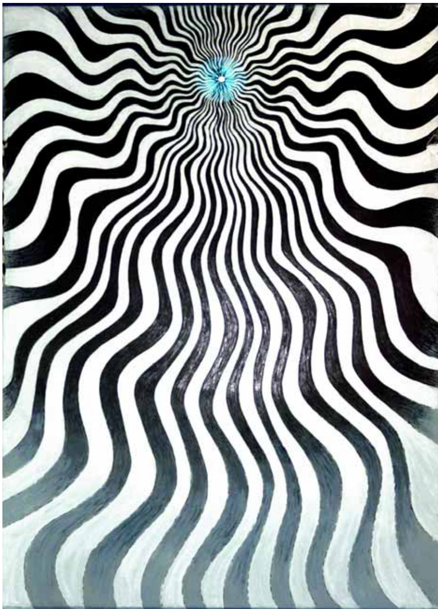
Tableau-sculpture - Côté PILE (VERSO)