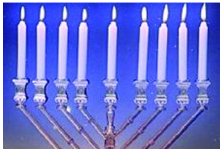
Un chandelier à 9 branches présent lors de la célébration de la fête de Hanoukka.

La création de cet espace sacré se fait, étape par étape, par le positionnement, et les actes ou paroles de chacun des officiants. Les symboles sont exposés, prêts à entrer en action. Activés par l'allumage des piliers, par le positionnement de l'équerre et du compas, le nécessaire de l'espace sacré est réveillé. Mais c'est seul le Très Respectable Maître qui va finaliser cette sacréalisation par l'invocation. C'est son rôle, c'est celui qui détient le pouvoir de donner la lumière, aussi bien aux initiés qu'au lieu. Au moment de l'invocation, par la puissance de la parole, de la gestuelle, au travers de l'Axis Mundi formé par l'épée flamboyante, le Très Respectable Maître et le maillet, l'espace humain se retire pour laisser sa place à l'univers sacré (peut-être par une