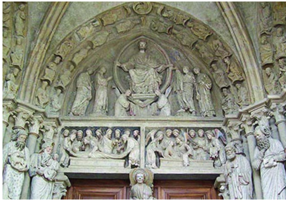
Le porche de l'entrée ouest de la Cathédrale symbolise-t-il la voie vers le Saint des Saints ?

«Dans tous les sentiers de la vie, le profane s'éveille le premier, alors le sacré est obligé d'apparaître, pour achever le renouvellement du profane, pour l'embellir et le dégager de son impiété. Le malheur c'est que le profane utilise son pouvoir de premier-né, le pouvoir du fait qu'il était né le premier à la lumière du monde et de l'activité, pour dire «c'est grâce à Moi, et il n'y a rien d'autre à part Moi» – il n'a aucun désir de connaître la sainteté, son intensité