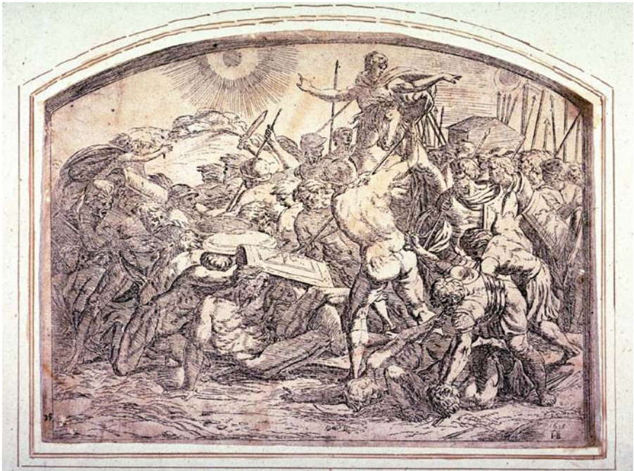
Josué s'adressant au Soleil et la Lune... Orazio Borgianni, d'après la fresque Raphael, 1615 © Vatican.

«De nos calculs, nous trouvons que la seule éclipse annulaire visible de Gabaon entre 1500 et 1050 avant J.-C. (en utilisant les mêmes limites approximatives aux dates possibles d'entrée de Josué en Canaan que Sawyer - 1972) était le 30 octobre 1207 avant J.-C. après midi.»