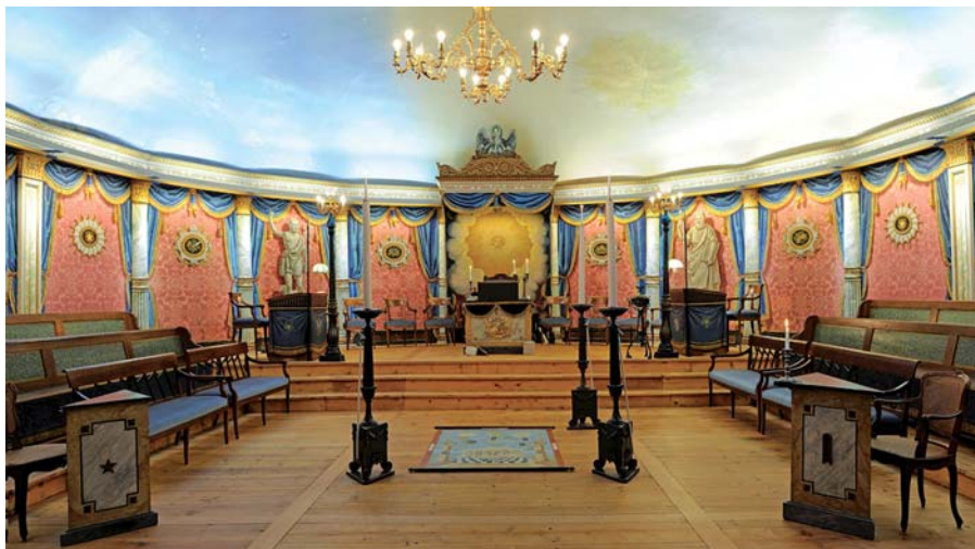
La Conférence suisse des conservatrices et conservateurs des monuments (CSCM) a remis le prix de la conservation du patrimoine à la Loge l'Amitié à La Chaux-de-Fonds, en reconnaissance de son impressionnant engagement dans l'excellente restauration intérieure et extérieure d'un monument singulier datant de 1844-45. Vue de l'Orient.

Nous avons fait notre libre choix de valeurs humanistes, démocratiques. La bête n'a rien à chercher sur nos colonnes.