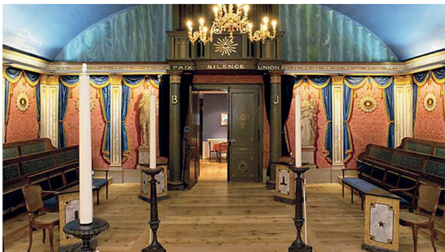
La Loge l'Amitié à La Chaux-de-Fonds. Vue de l'Occident.

royaume physique mais, inviolable, dans l'histoire de l'esprit humain, de la Civilisation.