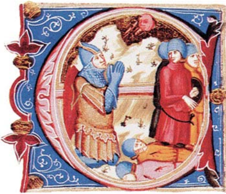
Josué arrête le Soleil et la Lune. miniature du XV e siècle.