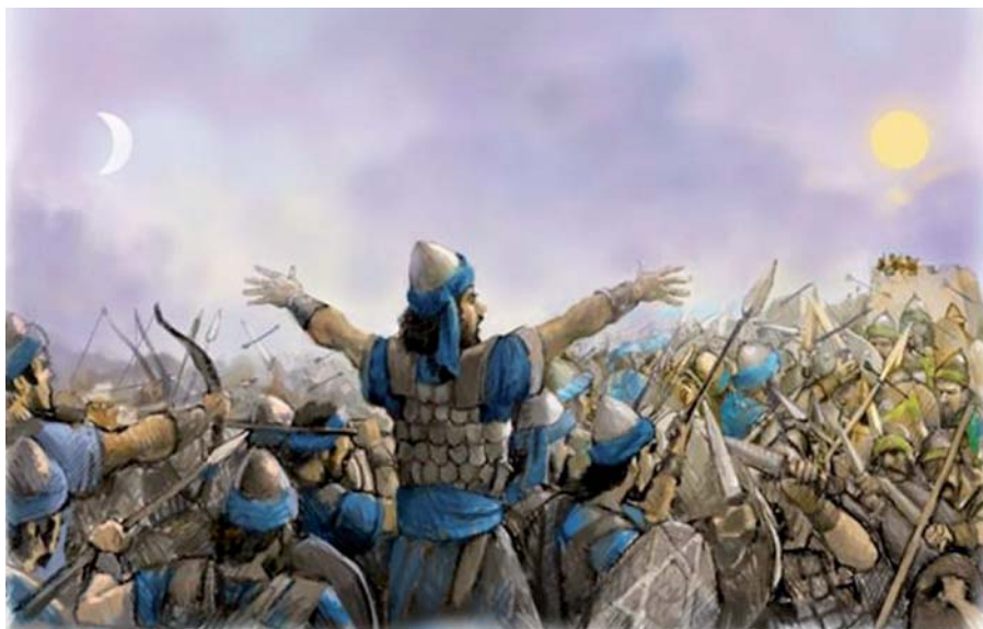
Et le soleil s'arrêta et la lune fit halte... (Josué 10,13). Illustration © N.C.

«Cela nous permet d'affiner les dates de certains pharaons égyptiens, y compris Ramsès le Grand. Il suggère également que les expressions actuellement utilisées pour calculer les changements dans la vitesse de rotation de la Terre peuvent être reculées de 500 ans de manière fiable, de 700 avant J.-C. à 1200 avant J.-C.»