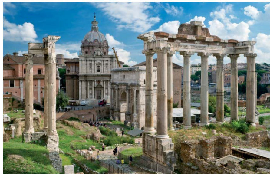
Le Temple de Saturne (Templum Saturni ou Aedes Saturni) est un des plus anciens temples romains construits autour du Forum de Rome. En ce lieu, il ne reste que les huit colonnes. Chaque année se déroulaient les Saturnales, durant le mois de décembre, fêtes où les esclaves étaient «libres», exceptionnellement exemptés du devoir de servir. Selon la tradition qui s'est perpétuée, les festivités donnent lieu à des échanges de cadeaux.