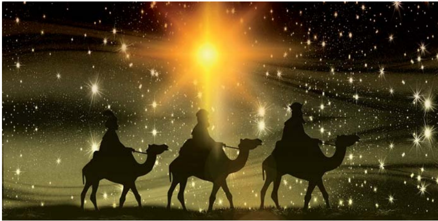
Épiphanie, une fête du symbole des Rois Mages guidés par la Lumière... © Illustration Anne Fonda.

s'allonger de façon sensible, que la promesse de la nuit solsticielle est tenue. On célèbre alors l'Épiphanie, la manifestation de la Lumière. Le christianisme a repris tout ce fond symbolique en assimilant la Lumière au Christ, puisqu'il est annoncé comme étant «la parole qui éclaire le monde».