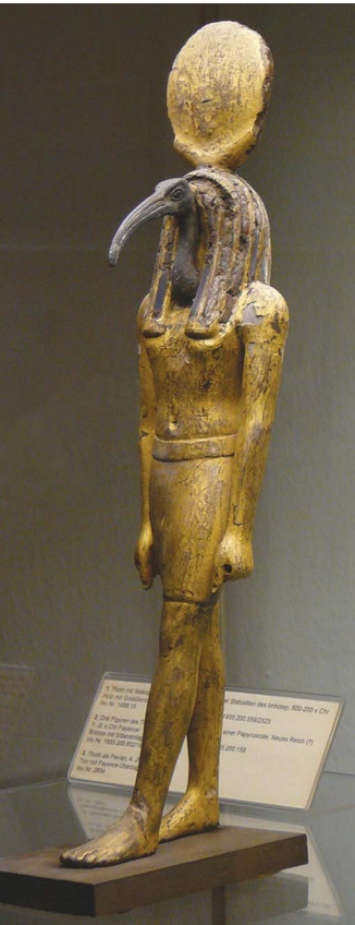
(Gauche) Thot (ibis). Photo © Musée d'Hanovre, Allemagne.