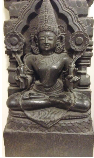
Sūrya, Dieu du Soleil, (Inde).