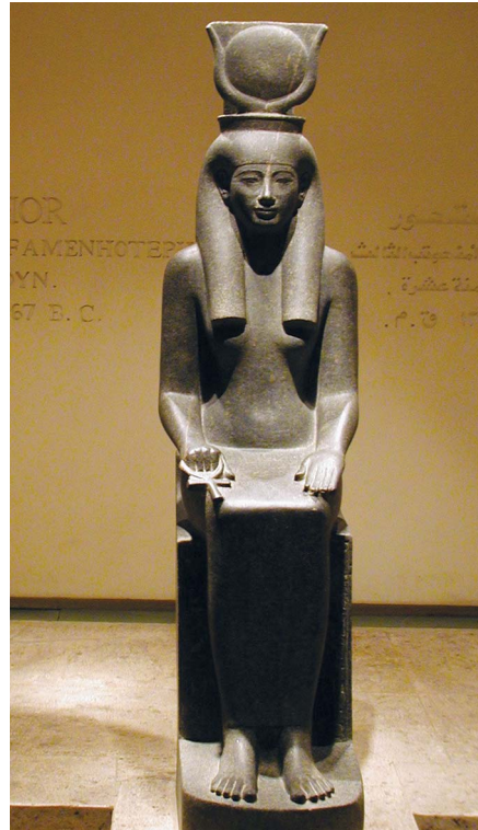
Statue de la déesse Hathor.