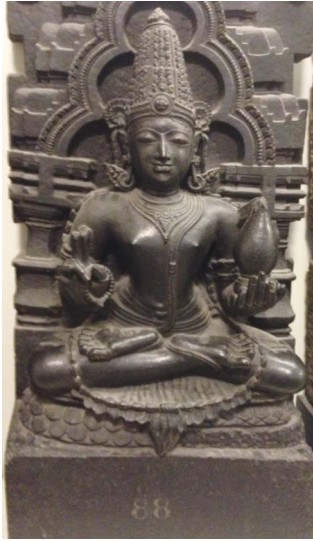
Chandra, Dieu de la Lune, (Inde).

THOT est le Dieu de la LUNE de l'Ancienne Égypte. Il est représenté parfois avec une tête d'ibis, de chien ou de babouin, avec un croissant de Lune sur la tête. Lune et Soleil se succèdent et se remplacent chaque jour. Lorsque le Dieu solaire Ra effectue son périple dans le monde souterrain, THOT, dieu lunaire, prend sa place dans le monde supérieur. THOT est, dans la mythologie égyptienne, le dieu lunaire de KHEMENOOU (Hermopolis Magna) 12 en Moyenne-Égypte.