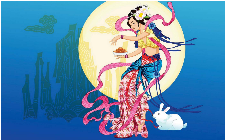
Chang'e déesse de la Lune s'envole... Le lapin lunaire ou de jade, dans la mythologie chinoise, est souvent présenté accompagnant la déesse de la Lune. Illustration © N.C.

La lune répand la pluie qui féconde les rizières. C'est elle qui ponctue le temps,