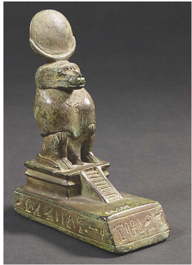
(Droite) Thot, sur sa tête le premier quartier de lune et au dessus le cycle complet lunaire, car il est également le dieu temps et le temps lunaire.

Représenté comme un ibis au plumage blanc et noir ou comme un babouin hamadryas, THOT capte la lumière de la lune, dont il régit les cycles, à tel point qu'il fut surnommé « le seigneur du temps ».