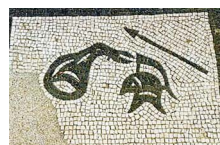
3. Miles (soldat), sac ou bissac, casque, lance, Mars.