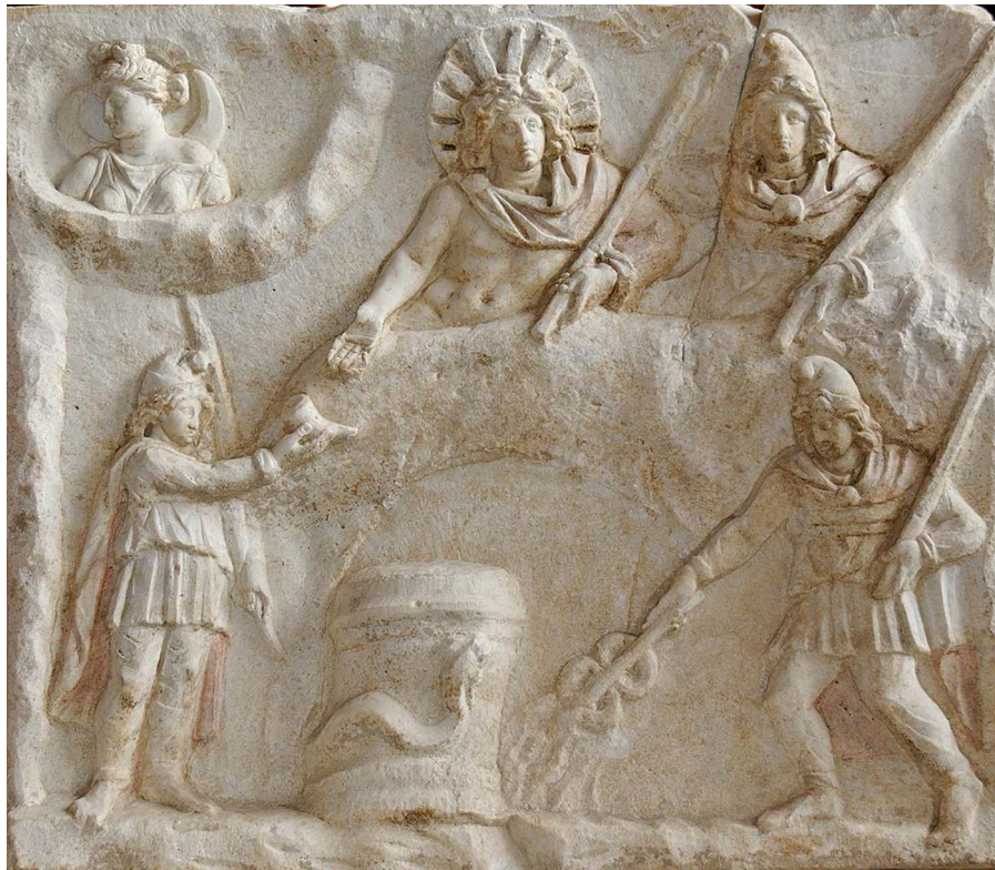
Relief mithriaque à double face. II e - III e siècle après J.-C.

Le 25 décembre était l'anniversaire du soleil et aussi de Mithra. On célébrait,