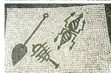
4. Leo (lion), sistre sacré, pelle à feu, Jupiter.