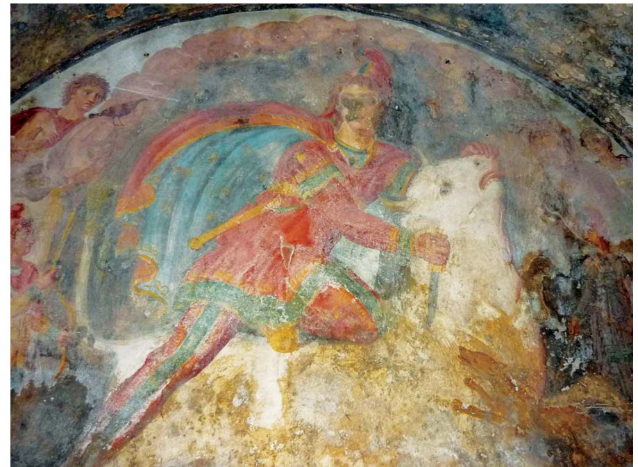
Fresque du Mithraeum de Capoue, Italie.

Mithra est un Dieu Aryen de la Lumière et de la loi, symbole de liberté, s'opposant à Varuna Dieu des Ténèbres.