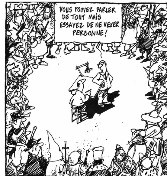
UNE PAROLE CIRCULE No 29/16 - octobre 6016