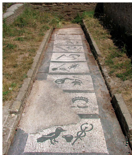
Felicissimus, à Ostie, Italie.

On connaît par Nonnus le Grammairien de la fin du VI e siècle les épreuves que les néophytes subissaient. Ils devaient traverser le feu et l'eau, endurer le froid, la faim, la soif et la fatigue de la marche. Les peintures de la caverne de Capoue montrent d'abord le néophyte les yeux bandés, il avance lentement d'un pas hésitant, tâtant des mains l'espace qui s'ouvre devant lui et ignorant où allait le mener son guide. Puis, toujours les yeux bandés, il est agenouillé devant un personnage casqué qui paraît l'éprouver par