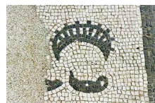
2. Nymphus (époux), ou Cryphius (occulte), diadème et la lampe de Vénus.