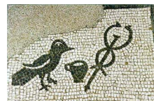
1. Corax (corbeau), messenger de Mithra, vase à ablutions, Mercure.