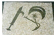
5. Perses (Persan), fertilité, poignard, faucille, étoile, lune.