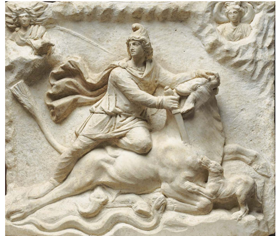
Relief mithriaque à double face. IIe - IIIe siècle après J.-C., © Musée du Louvre, France.

Le taureau de Mithra est souvent représenté dans une sorte de barque ou de croissant lunaire. La figuration du Zodiaque au-dessus ou autour de l'effigie de Mithra confère au sacrifice une grandeur cosmique. Il représente la victoire de la vie sur les forces du mal car la mort du taureau engendre la vie. Le scorpion symbolise les forces du mal puisqu'il tente de châtrer le taureau et de corrompre ainsi la semence fécondante.