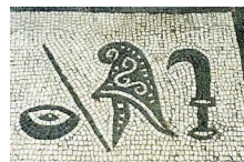
7. Pater (père), bonnet phrygien, faucille, baguette de commandement, patère, anneau, Saturne.