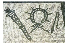
6. Heliodromus (messager du soleil), couronne solaire, torche, fouet.