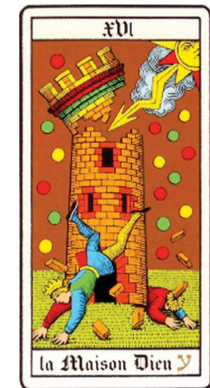
Quelques variantes de couleurs et de symboles de la 16 e lame du Tarot. Elles comportent des différences telles que le nombre des sphères ou la présence de la porte..