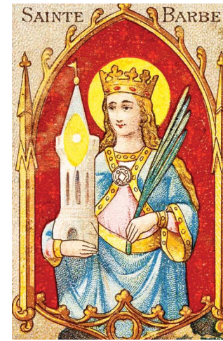
Sainte Barbe est devenue au fil du temps l'égérie de multiples fêtes religieuses. Illustration © R.D.

Claude Le Moel apporte plusieurs précisions: «La Maison Dieu dans le livre de Thoth, a pour dixième signe Shem/Sagittaire dans le Zodiaque sacré. C'est le premier Nombre de ce sixième ternaire (16-17-18), qui donc est sous l'influence de la Providence comme l'est le Nombre Sept, sa réduction théosophique (1+6 = 7). Il en est de même si nous additionnons tous les Nombres jusqu'à Seize, nous obtenons la somme de 136 qui en réduction théosophique nous donne Dix puis Un, la Providence...»