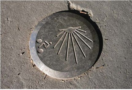
Pampelune, balisage du chemin de Compostelle.

mal connu. Par contre, ce pèlerinage est authentifié par les écrits de Gomesano, moine du couvent espagnol de Saint-Martin d'Albeda. «Les Bourguignons et les Teutons», et, plus généralement les Jacquets venus de l'est de l'Europe, donc les Suisses, débutaient leur pérégrination par le grand sanctuaire marial qui a donné son nom à la Via Podiensis.