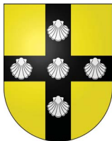
Commune de Cartigny, Genève.