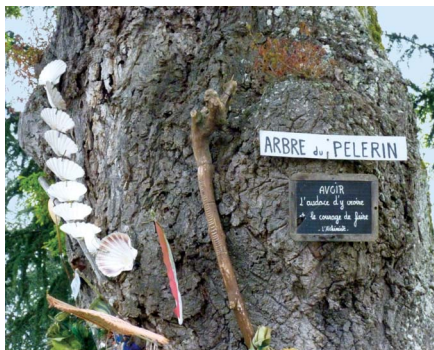
Arbre du pèlerin au lieu-dit Vignes, proche du Moulin de Louvigny.

Salomon était faite d'olivier. Le pèlerin peut graver sur le manche ses initiales sa devise, des symboles, ce qui lui est important. Pour le fût on choisit le chêne, qui borde le chemin du pèlerin quelle que soit la région traversée. Il est symbole de FORCE et de SAGESSE et on ne peut manquer de s'émerveiller de sa BEAUTE. On utilise aussi le frêne, symbole de puissance chez les grecs, d'immortalité dans la tradition scandinave, il est l'arbre d'Odin, idéal pour les travaux runiques et divinatoires, ou plus largement ésotériques. Au coeur du bourdon, entre manche et fût se trouve le compartiment scellé, ce petit tube dans lequel le pèlerin scellera le secret qui l'accompagnera tout au long du chemin: une prière, une intention, un peu de la terre de son pays ou encore une mèche de cheveux... Le bourdon est traditionnellement orné d'une coquille St Jacques en argent, symbole de pureté. En héraldique, on retrouve parfois une représentation du bourdon ou de la Coquille