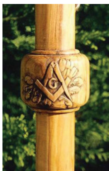
Bourdon, bois de lumière.

Les 2 parties du bourdon peuvent être fabriquées de différents bois: chêne, frêne, olivier, buis, chacun avec sa symbolique propre. Le manche est généralement fait de buis, symbole de fermeté et de persévérance ou d'olivier: symbole de lumière et de paix. Certains prétendent que la porte du temple de