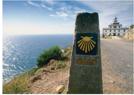
Le Cap Finisterre, le point le plus occidental de l'Espagne continentale.