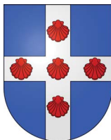
Commune de Céligny, Genève.