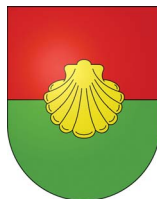
Commune de Vandoeuvres, Genève.

Saint Jacques dans les armoiries de person- nages ayant effectué le voyage. On peut les retrouver aussi dans le blason des villes étapes sur le Chemin. Et en Suisse aussi, bien entendu: le canton de Glaris ou dans les blasons des communes de nombreux cantons.