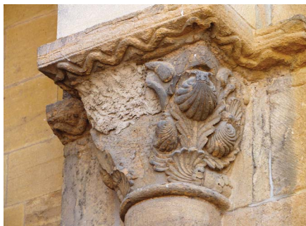
L'église Saint-Fortunat à Charlieu. Chapiteau avec les coquilles Saint-Jacques marquant le passage des pèlerins de Compostelle au-dessous du symbole de l'eau.

voyage. Bien qu'elle puisse être un ornement architectural sans lien avec Compostelle, elle est le symbole omniprésent du pèlerinage. On la retrouve gravée dans la pierre sur les frontons ou les chapiteaux des églises. Sur la façade des maisons, elle indique au pèlerin qu'en ce lieu il sera accueilli et trouvera gîte et couvert. De bronze dans les rues pavées, sur les panneaux, sur les arbres, ou bien encore sur des bornes, elle balise le chemin et guide le pèlerin