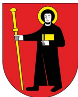
Canton de Glaris, Suisse alémanique.