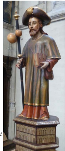
Statue du pèlerin de Saint Jacques de Compostelle.

Les pèlerins avaient pour coutume de rapporter comme témoignage de leur voyage des coquilles de PECTENS, mollusque abondant sur les cotes de Galice, qu'ils fixaient à leur manteau ou à leur chapeau, d'où le nom de coquille Saint-Jacques donné par la suite à ces coquillages. Cette coquille deviendra l'un des attributs du pèlerin, avec le bourdon, la besace et le chapeau à larges bords. La coquille Saint-Jacques symbolisait l'homme nouveau qui rentrait au pays à l'issue du