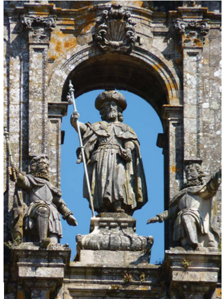
Saint Jacques de Compostelle: Statue de St-Jacques le Pèlerin.

Jacques est défini par le nom gréco-hébreu de YAKOB qui compte cinq lettres. Si le nombre cinq, qui est un signe d'ordre et de perfection, définit son être, il y a là une raison de situer son anniversaire dans le cinquième mois de l'année et, puisque que celle-ci commençait le 1er mars, au mois de juillet. Quant à la date elle-même du 25, elle résulterait du fait que 25 est le carré de 5. L'accession à la qualité de martyr d'un personnage dont 5 est le chiffre terrestre représente une exaltation suprême de son être. Le 25 du mois semble donc le quantième le plus approprié à cette fin. Mais on peut aussi remarquer que chez les Romains, cette date marque le début de la Canicule. Elle va permettre d'intégrer au personnage de Jacques des déterminations