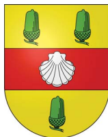
Commune de Presinge, Genève.